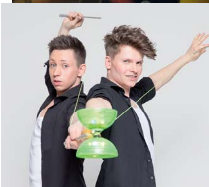
Das Duo „Twin Spin“ begeisterte mit seiner einzigartigen Diabolo-Show.

Was wäre der November ohne unsere Seniorenfeier, auf die sich viele unserer älteren Mitglieder immer schon lange im Voraus freuen. So auch in unserem Jubiläumsjahr 2018, in dem wir rund 350 Gäste in der Sängerkirche in Untertürkheim zu unserem größten Fest im Jahr begrüßen durften.