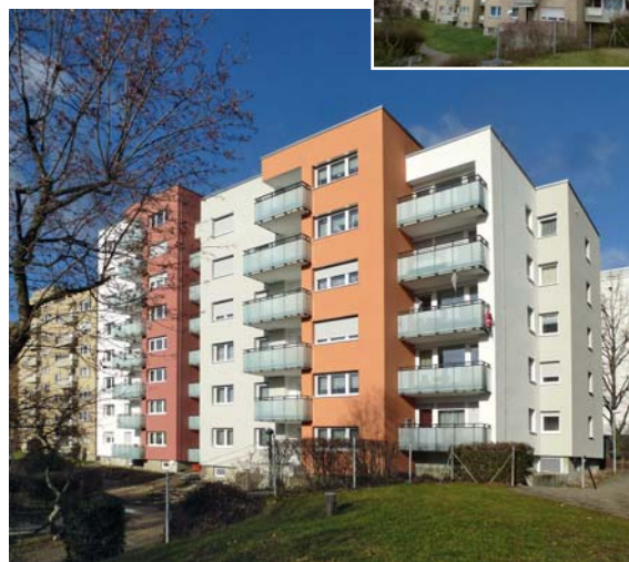
Rohrdommelweg 10 und 12 vorher und nachher

Diesen werden wir zeitnah im Frühjahr 2019 angehen, so dass sich alle betroffenen Mieter bereits vor dem nächsten Winter in ihrer umfangreich sanierten Wohnung wohlfühlen können. Für etwaige Beeinträchtigungen, die leider nicht immer ohne Lärm und Dreck durchführbar sind, bitten wir schon heute alle Mieter des Rohrdommelwegs um Ihr Verständnis und bedanken uns für Ihre Mitwirkung im Rahmen der erforderlichen Arbeiten. Was sie nach den überstandenen Strapazen erwartet, kann sich aber mehr als sehen lassen, wie der bildliche Vorher-Nachher-Vergleich des ersten Bauabschnittes im Rohrdommelwegs 10 und 12 eindrucksvoll beweist.