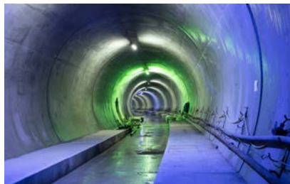
Tunnel Bad Cannstatt

Welche Möglichkeiten bietet das Bahnprojekt Stuttgart-Ulm für die Stadt und die Region? Was ist schon geschafft und wie geht es weiter? Antworten auf diese Fragen können Groß und Klein im ITS erforschen. So leitet die interaktive Medieninstallation „The Cave“ durch den gesamten neuen Bahnhof und haptische Modelle verdeutlichen die verschiedenen Neubaustrecken. Wer mag, nimmt an einer der Baustellenführungen, darunter sind auch drei Tunnelführungen, teil und Kinder können sich an Spielen sowie digitalen Anwendungen versuchen, die speziell für sie entwickelt wurden.